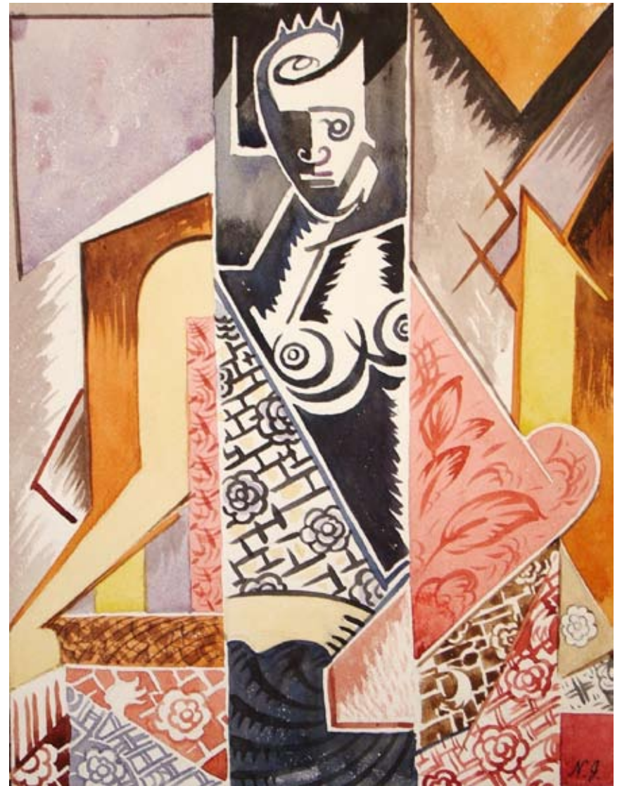
N. Gontcharov - Femme au châle (Espagnole) - 1919 -aquarelle - 22,9 x 17,8 cm

Tombé dans l'oubli dans les années 1930, l'exposition londonienne de 1954 organisée par Camilla Gray, permet sa redécouverte et inaugure ainsi les recherches et expositions visant à rendre à cet art la place qui lui est dû.