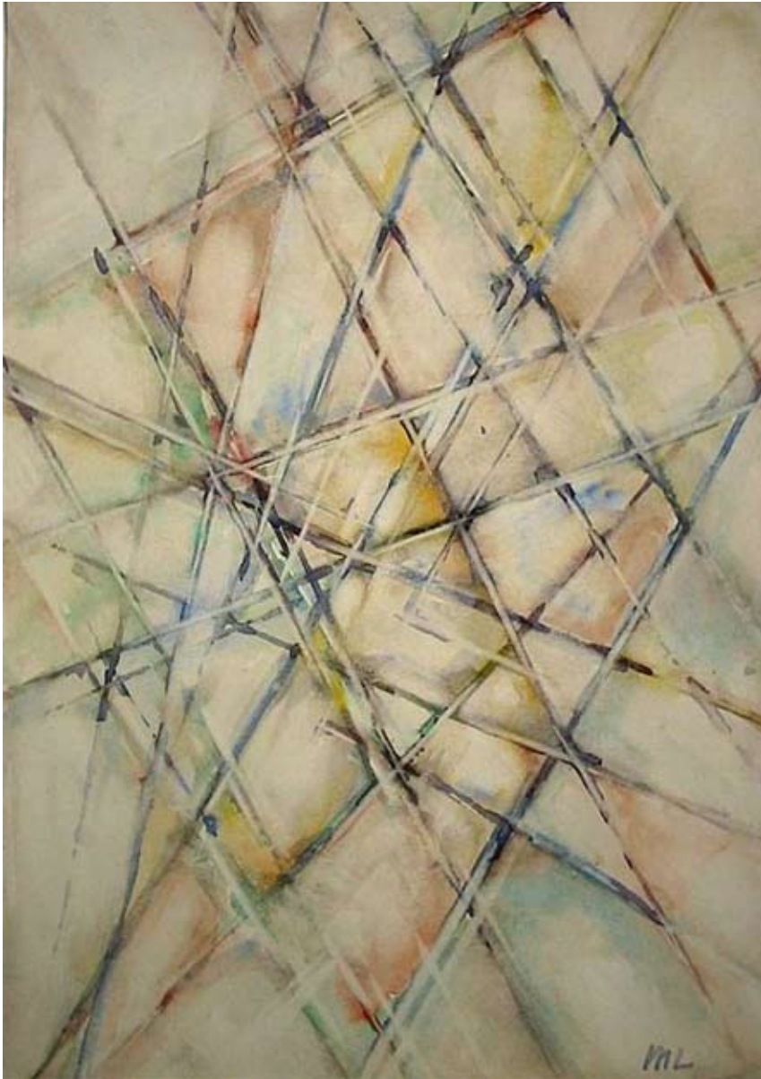
M. Larionov - Composition rayonniste - C. 1913 gouache sur papier - 36 x 25,5 cm