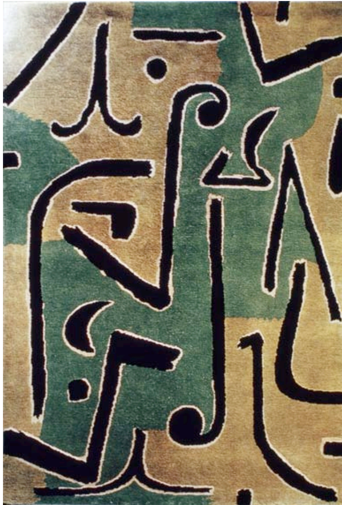
Paul Klee "Brins d'herbe", 230 x 150 cm, tapis laine point noué