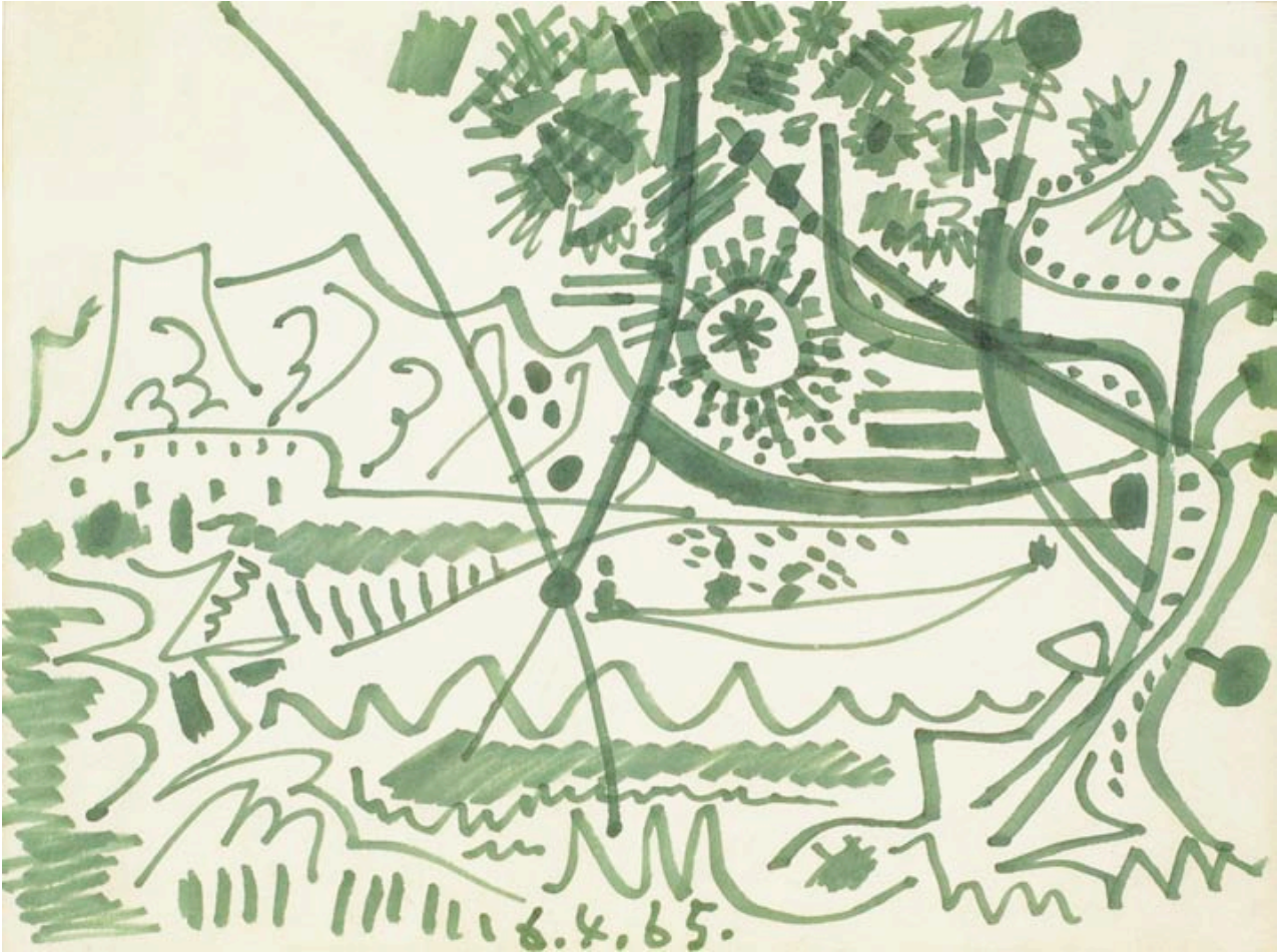
Pablo Picasso "Mougins", 235 x 180 cm, tapis laine point noué