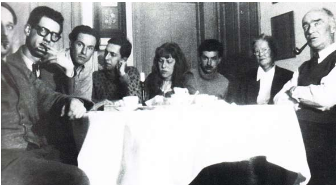
En 1948, de gauche à droite: A. Jorn, C. Dotremont, Corneille, Constant, T. & K. Appel

Suite à de nombreuses expositions à Bruxelles, le groupe CoBrA investit le Stedelijk Museum à Amsterdam pour l'exposition internationale d'Art expérimental en novembre 1949