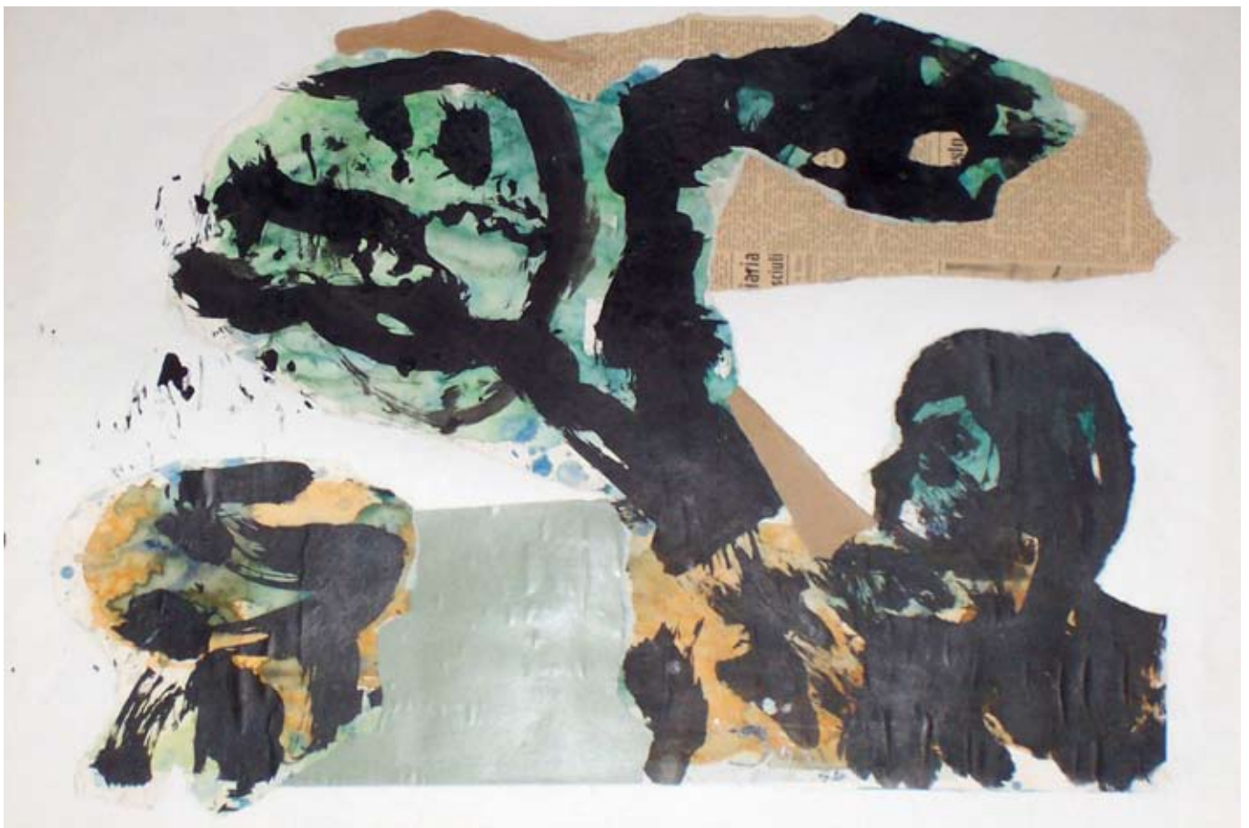
A. Jorn, «Renards», collage et gouache sur papier, 1954, 50 x 70 cm

Aussi, leur démarche s'inscrit dans un total rejet de la norme et de la convention. Ils adoptent alors un langage primitif qui se traduit par un intérêt pour la préhistoire, l'art populaire médiéval, l'art naïf et les créations enfantines. Ce sont pour eux des expressions au plus près de l'individu de son psychisme, de son subconscient et de son authenticité.